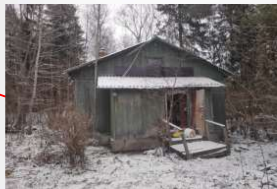
Жилой дом, лит. А-а (Служебная постройка) Площадь: 47,2 кв.м