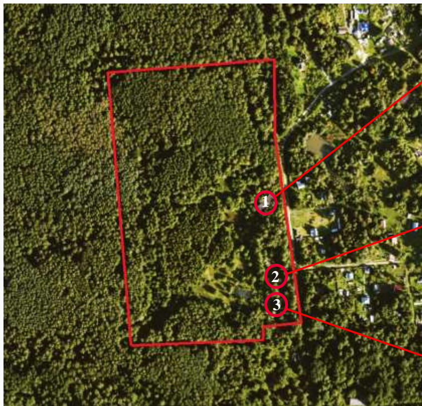
Земельный участок Площадь: 100 000 кв.м