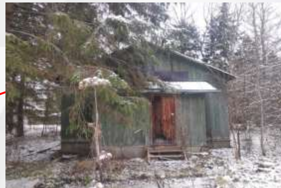
Жилой дом, лит. А-а (Служебная постройка) Площадь: 46,2 кв.м