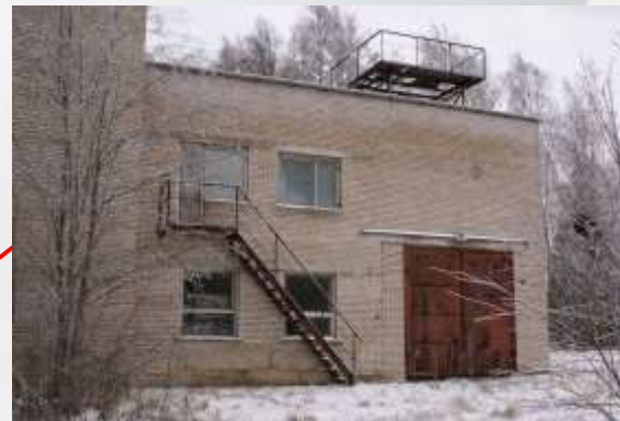
Испытательный стенд, лит. Б. Площадь: 383 кв.м