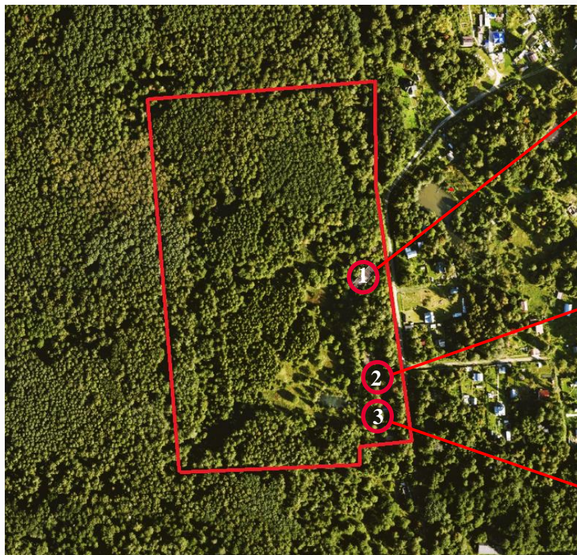
Земельный участок Площадь: 100 000 кв.м