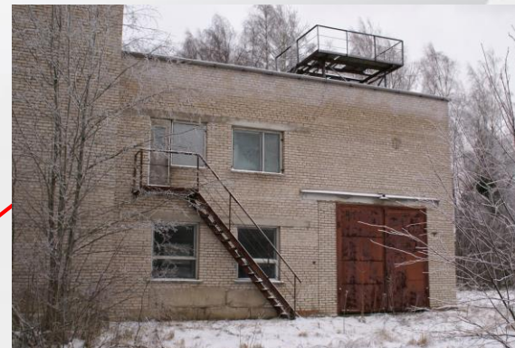
Испытательный стенд, лит. Б. Площадь: 383 кв.м