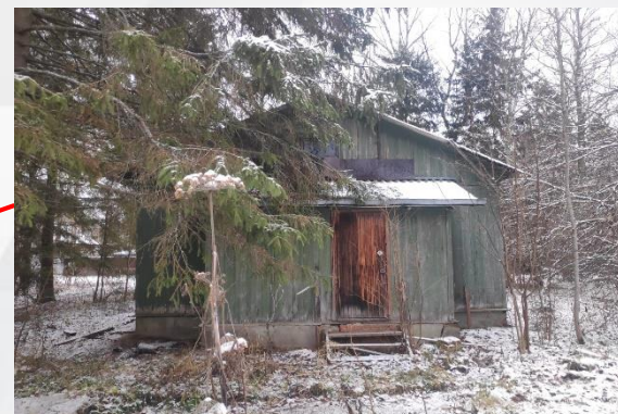
Жилой дом, лит. А-а (Служебная постройка) Площадь: 46,2 кв.м