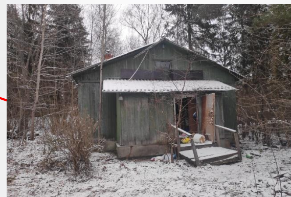
Жилой дом, лит. А-а (Служебная постройка) Площадь: 47,2 кв.м